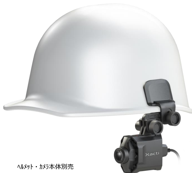
ヘルメット・カメラ本体別売