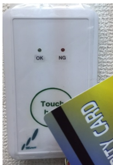
カードとの併用、電子錠との連動が可能