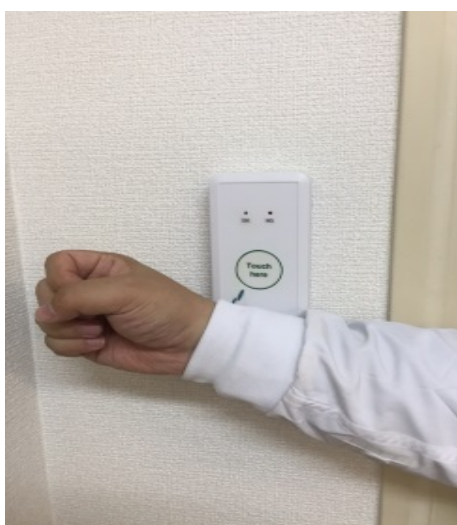
非接触で入退室管理が可能