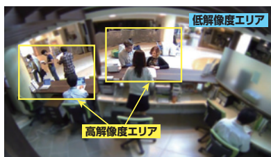
※写真はVIQS機能説明のためのイメージです。