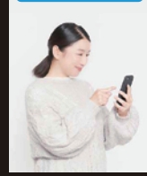
リアルタイムで通知