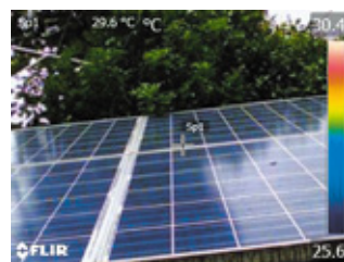
デジタルカメラモード

MSX ® 機能(スーパーファインコントラスト機能)は、リアルタイムで画像を補正することができ、構造物の詳細や発熱箇所の判別が熱画像上で容易に行えます。また、デジタルカメラモードとの同時撮影も可能で、同画角の可視画像を簡単に生成することができます。