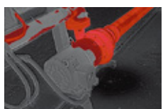
閾値設定機能 カラーアラーム機能