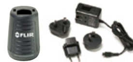
充電器 (ACアダプタ付) ¥30,000