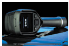
国内フルメンテナンス