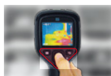
片手で全ての操作が可能