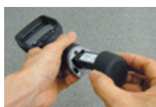
リプレーサブルバッテリー